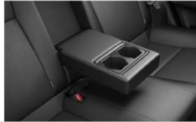
VERSIONES S y XLS Pack CVT

La rigidez de la carrocería, sumando puntos de soldadura y el trabajo en el seteo de la suspensión, fueron otros de los puntos optimizados para mejorar el confort de todos los pasajeros.