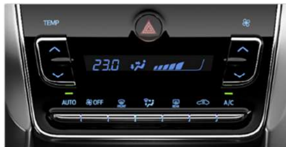
VERSIONES S, XLS PACK CVT y XLS

Todas las versiones del nuevo Yaris están equipadas con cierre centralizado de puertas con comando a distancia, levantavidrios eléctricos en las 4 puertas y regulación eléctrica de los espejos exteriores. Por su parte, las versiones S, XLS Pack CVT y XLS suman además, aire acondicionado con climatizador automático digital, espejo retrovisor interno anti encandilamiento automático, sistema “One Touch” en los levanta cristales de las 4 ventanillas y espejos exteriores retráctiles eléctricamente.