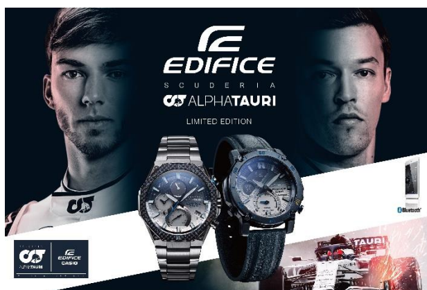
EQB-1100AT / ECB-20AT

Diseños con los colores blanco y azul marino de la escudería