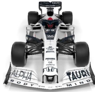
auto de carrera de Scuderia AlphaTauri F1