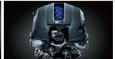
MOTOR 5.0L V8