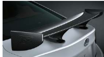
ALERÓN FIJO DE FIBRA DE CARBONO (CFRP)