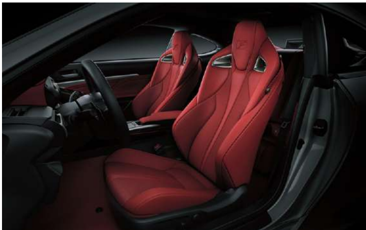
BUTACAS PERFORMANCE F TAPIZADAS EN ALCÁNTARA®