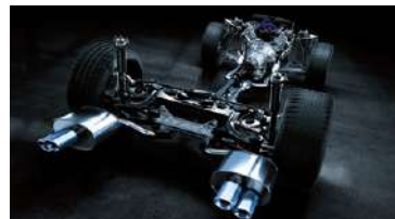
SISTEMA DE ESCAPE CONFECCIONADO EN TITANIO®