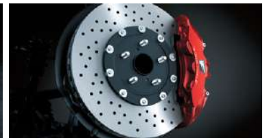
SISTEMA DE FRENSO BREMBO® CON CALIPER ROJO DISEÑO F