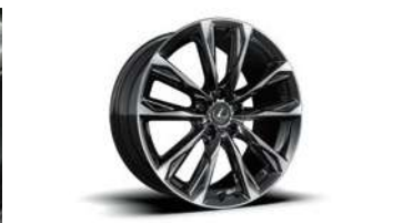
NEUMÁTICOS DELANTEROS 235/40 R19 Y TRASEROS 265/35 R19