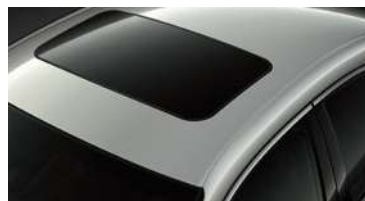
TECHO SOLAR ELÉCTRICO