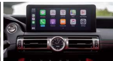
PANTALLA 10,3" CON CONECTIVIDAD APPLE CARPLAY™ Y ANDROID AUTO™