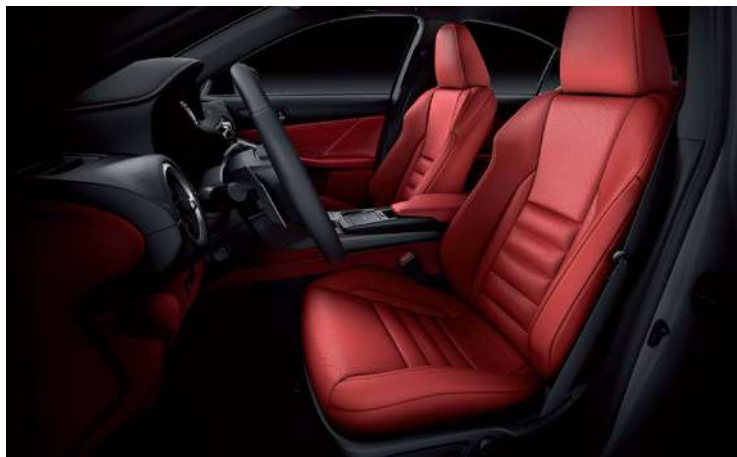
ASIENTOS DELANTEROS DISEÑO F-SPORT