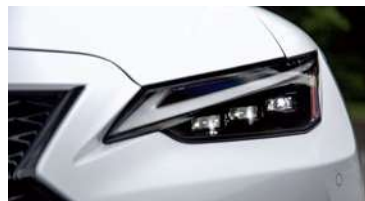
ÓPTICAS DELANTERAS MULTI-LED CON NIVELACIÓN AUTOMÁTICA Y LAVAFAROS