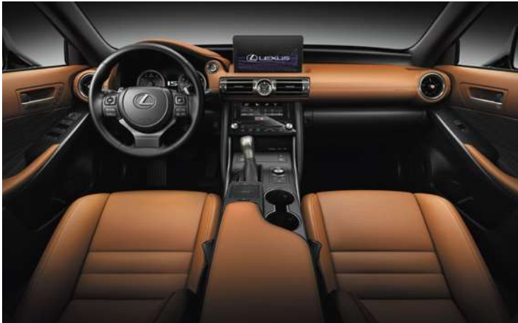
ASIENTOS DELANTEROS ELÉCTRICOS CALEFACCIONADOS Y VENTILADOS CON MEMORIA PARA EL CONDUCTOR