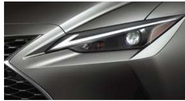
ÓPTICAS DELANTERAS LED