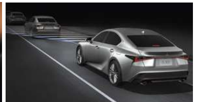
CONTROL DE VELOCIDAD CRUCERO ADAPTATIVO