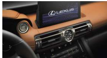
PANTALLA 10,3" CON CONECTIVIDAD APPLE CARPLAY™ Y ANDROID AUTO™