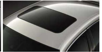
TECHO SOLAR ELÉCTRICO